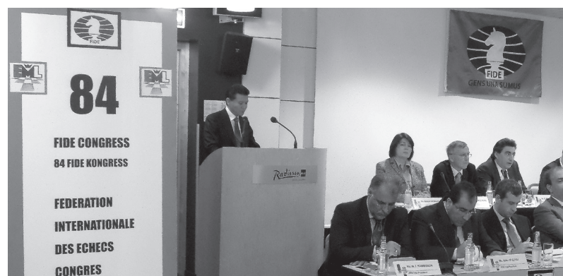
FIDE president Kirsan Iljumžinov (kõnepuldis) esitas põhjaliku kokkuvõtte aruandlusperioodi kohta.