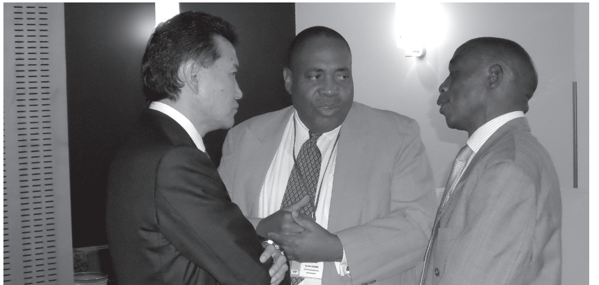
FIDE president Kirsan Iljumžinov kohvipausil Aafrika delegaatidega vestlemas.

Mõne aja möödudes tekkis selle tunde asemele paraku hämming ja pidulik kongressi avapäeval koguni sügav häbitunne. Milles küsimus? Kogu üritus möödus täielikus meediavaikus. Asjaolu, et maleüritustele on juba aastaid üritanud hinge sisse puhuda Eesti Male Toetusühing, mõningad maleklubid, malekoolid ja ringid, pole meie maleelus piisav. Aga see selleks. Kongressil polnud kohal ühtegi Eesti Vabariigi valitsuse liiget, parlamendisaadikut, linnavalitsuse tegelast ega ka ühegi TV kanali reporterit või ajalehe korrespondenti.